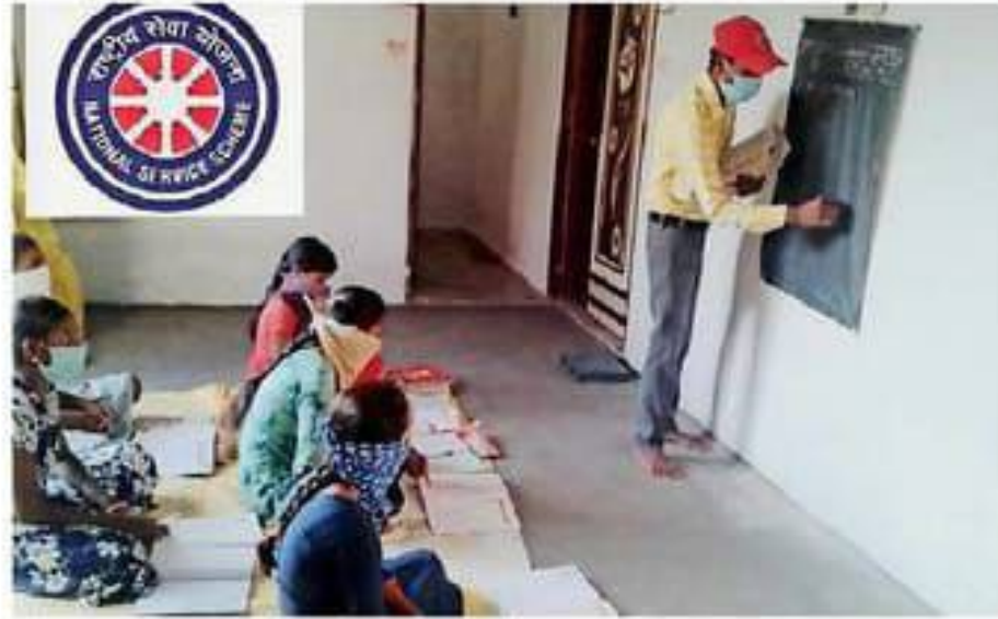
बागबाहरा. बच्चों को पढ़ाते हुए स्वयंसेवक।

स्वयंसेवकों ने छोटे बच्चों से मिलकर उन्हें गुड टच एवं बैड टच की जानकारी देकर खेल- खेल में पढ़ना लिखना-सिखा एवं गर्भवती माताओं से मिलकर अस्पताल में ही प्रसव कराने की जानकारी दी। जननी सुरक्षा योजना, भगिनी प्रसूति सहायता योजना के बारे में विस्तार से